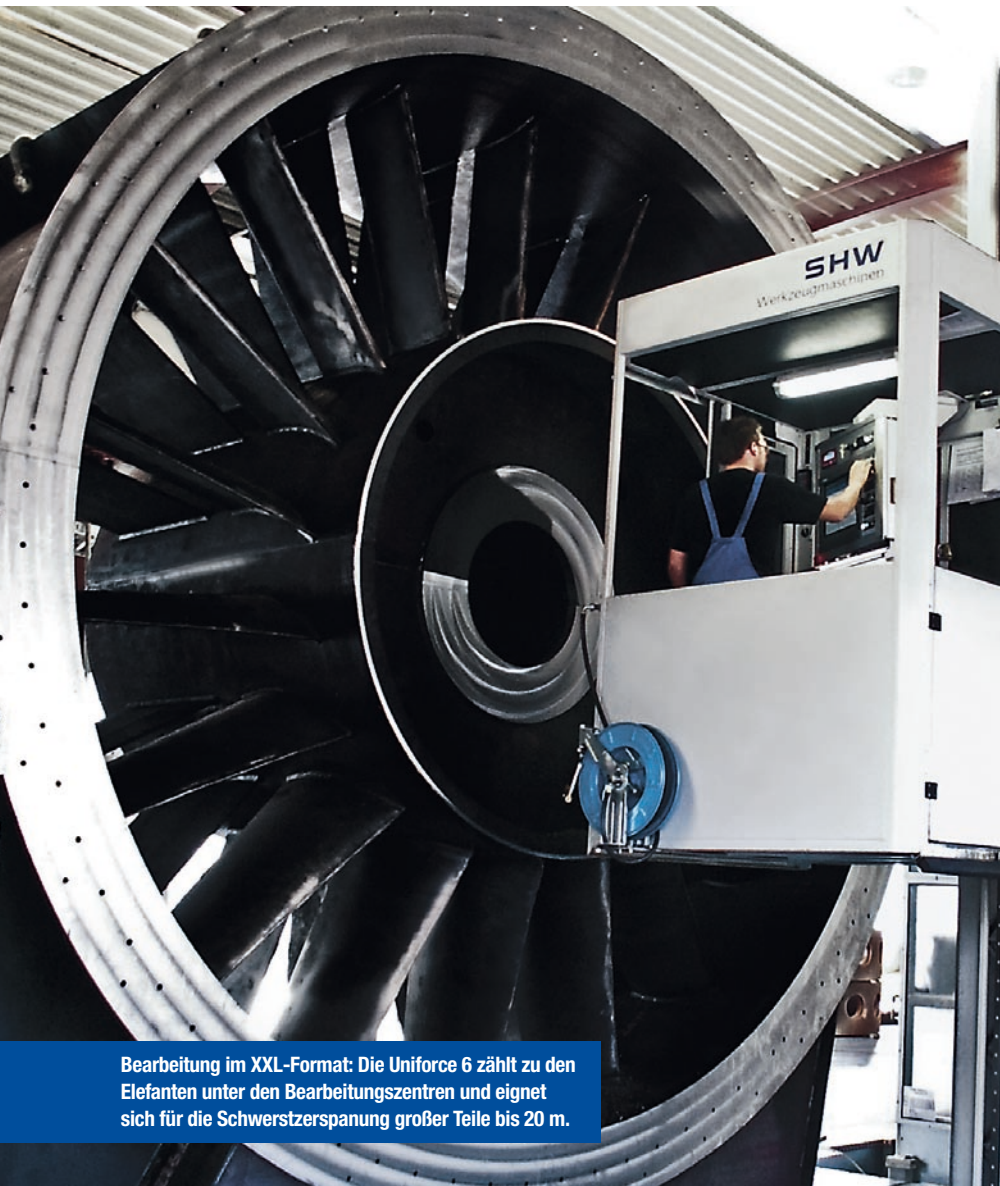
Bearbeitung im XXL-Format: Die Uniforce 6 zählt zu den Elefanten unter den Bearbeitungszentren und eignet sich für die Schwerstzerspannung großer Teile bis 20 m.

„Durch diese speziell für uns von SHW angefertigten beiden Sonderköpfe kann die Uniforce 6 auch wie ein Bohrwerk eingesetzt werden“, erklärt